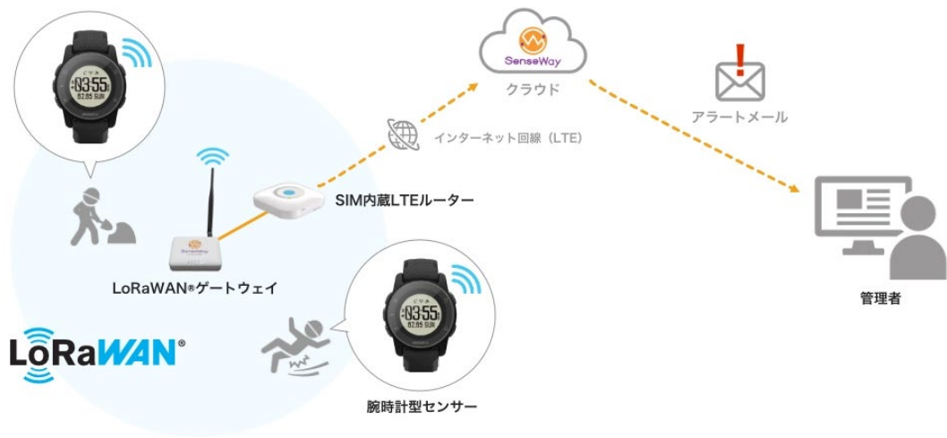
ワーカーコネクト (LoRaWAN) サービスイメージ