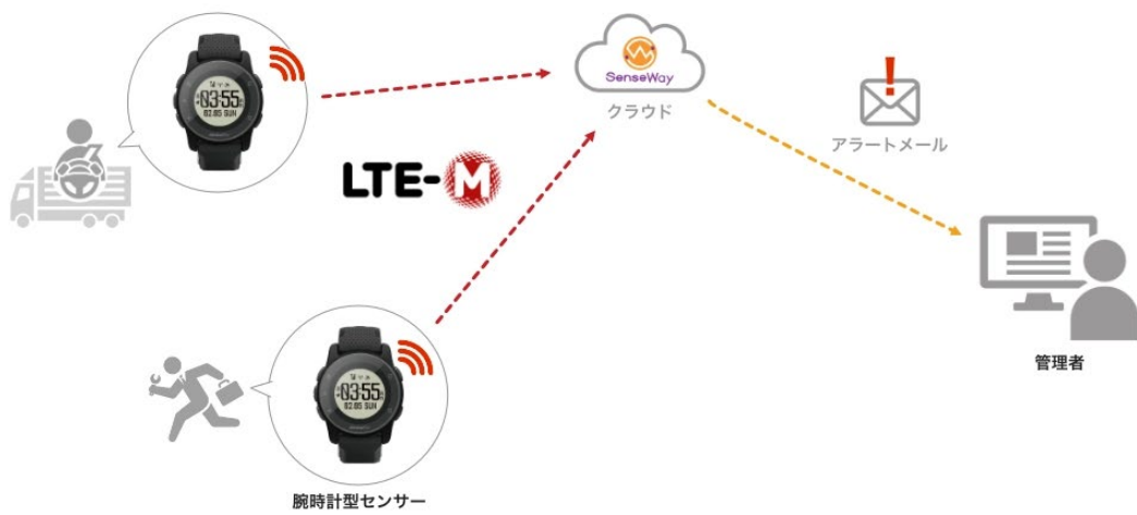
ワーカーコネクト (LTE-M) サービスイメージ