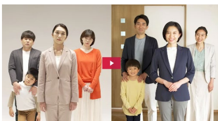
戸建て住宅販売編

https://m-arch-log.com/?ID=housingsalesmovie