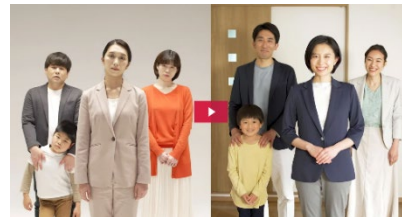
戸建て住宅販売編