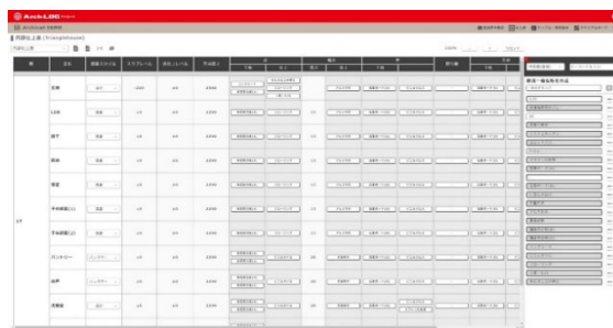
▲デモで紹介した近日公開予定の Arch-LOG の仕上表

さらに、今後公開予定の新たな管理機能として、「製品ロック機能」や「メンテナンスアラート機能」についても紹介しました。「製品ロック機能」は竣工時の建材の製品情報をロックすることで、竣工時のデータをそのまま残すことができます。これにより、竣工後の製品の入れ替えやデータの属人化を防ぎ、いつでも竣工時の状況を関係者間で確認することができます。「メンテナンスアラート機能」は、竣工物件情報をクラウド上でデータベース化してあらゆる建材を管理し、製品の耐用年数に応じてメンテナンス時期をアラートでお知らせする機能です。竣工後に顧客との関係が薄れてしまうといった課題の解消に対応するほか、リフォーム市場開発でタイムリーに顧客へ提案することができるようになるため、他社との差別化による市場での競争力強化につながります。