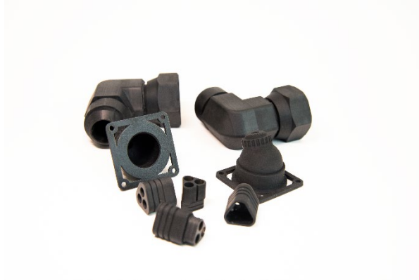
Origin One の造形モデル