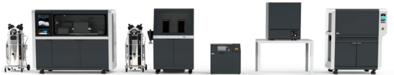
Shop システム全体構成

左から順に プリンター、パウダーステーション、ブレンダー、ドライオーブン、ファーネス