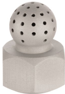
バルブノズル モデル

左から順に プリンター、パウダーステーション、ブレンダー、ドライオーブン、ファーネス