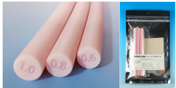
医工連携により開発された「血管縫合剥離トレーニングキット」。実際の血管に近い質感を実現し、切離や剥離など細やかな術技の研修に活用できる。

この血管縫合剥離トレーニングキットは、外科医からの要望と監修を踏まえ、スワニー独自のデジタル設計と最新の工業用 3D プリント技術により開発されました。同トレーニングキットに含まれる血管モデルは実際の血管の質感にきわめて近い形で再現されているため、複雑で繊細な手技が必要とされる血管縫合のトレーニングに活用することができます。また、この血管モデルは自動縫合器にも対応しており、実際の血管切離同様のリアルな切離断端が形成されます。