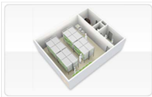
【植物工場/イメージ】

各社の役割として、昭和電気は「S法」と栽培システムを提供します。国内や宇宙ステーションでの作物栽培の実証研究で培ったノウハウを活用して千代田化工建設は設計・調達及び管理を行います。丸紅は植物工場の推進及び市場開拓を行います。