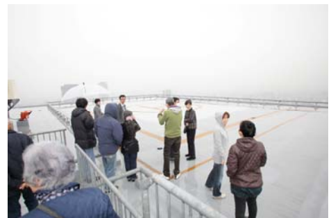
普段は入れない屋上ヘリポートを見学

イベントでは、マンション居住者様が家具転倒防止や食品の備蓄など普段からできる備えをご紹介しました。また、参加者同士で応急手当を体験していただいたワークショップでは、 「災害時マンション居住者で助けあう必要性をあらためて感じた」というお声を参加者の方からいただきました。