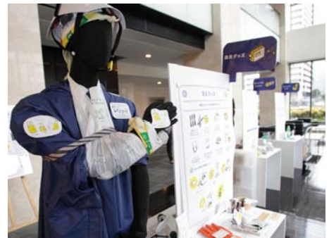
防災グッズを見て触れるエントランスの展示

今回は NPO 法人プラス・アーツご協力のもと、超高層という構造と居住者の特性にあわせて「防災ミニ講座」「体験ワークショップ」「マンション非常用設備の見学ツアー」を開催。