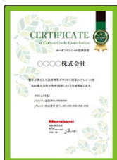
<カーボンクレジット償却証書>