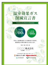
<温室効果ガス削減宣言書>