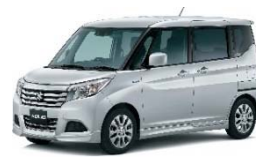
< ソリオ >