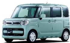
< スペーシア >