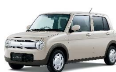
< ラパン >