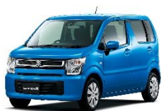
< ワゴンR >