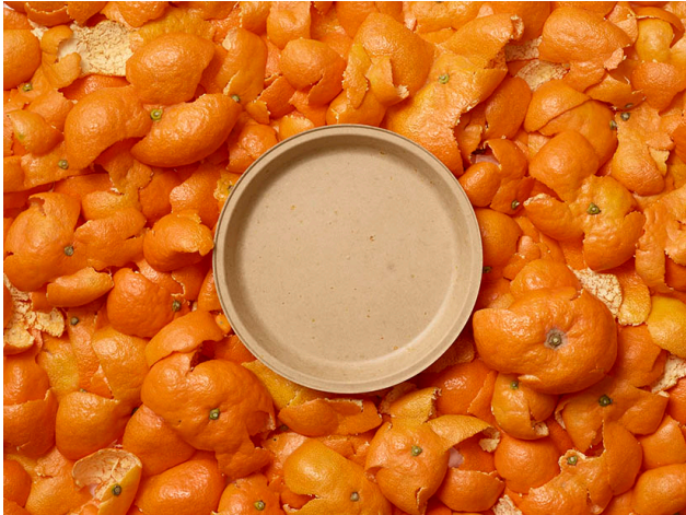
みかんの皮から生まれた『edish』