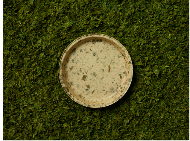
使用済み茶葉から生まれた『edish』